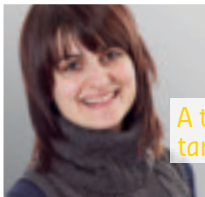
A tschaina tar parents

En il rom dad ina scolaziun che jau hai fatg essan nus stads la primavaira per insaquants dis en l'Italia, pli precis en las Dolomitas a visitar noss parents linguistics, ils Ladins. Nus avain visità la Rai Ladinia e l'Institut Ladin, essan stads en il museum, ad ina prelecziun a l'universitad, avain tadlà referats ed in concert, etc. Per pudair sa far in'idea d'ina cultura tutga per mai dentant era tiers l'aspect culinaric. Durant noss viadi è quel vegnì in pau a la curta. Sur mezdi avain nus savens gì stress per arrivar ad uras al proxim termin ed uschia restavan magari mo paucas minutas per in paunin. Ma almain essan nus ids mintgamai la saira en in'ustaria a tschaina.