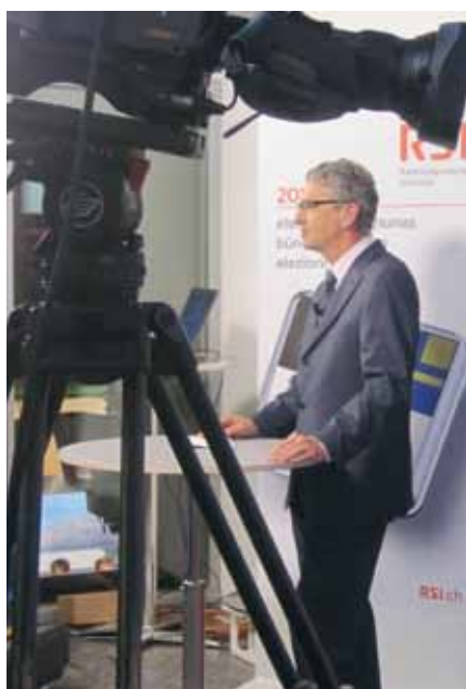
center da medias preschenta RTR ils resultats che vegnan communitgads regu- lain da la chanzlia chantunala. Or dal center da medias vegnan era las emissiuns TR.