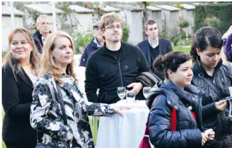
En il curtin da las rosas a Haldenstein: l'aura tegn anc!

Las var 50 persunas da RTR han giudì la saira ch'ha entschet davant la culissa d'edifizis istorics a Haldenstein ed ha stuì vegnir spustada pervia da plievgia per la segunda mesadad en il teater da la citad da Cuira. L'inscenaziun nunspetgada en dus lieus ha dà l'ocasiun al public da cumparegliar dus tips cumplettamain differents da producziun, d'acustica e d'interpretaziun. Sco sche quai fiss stà ina part dal drama musical.