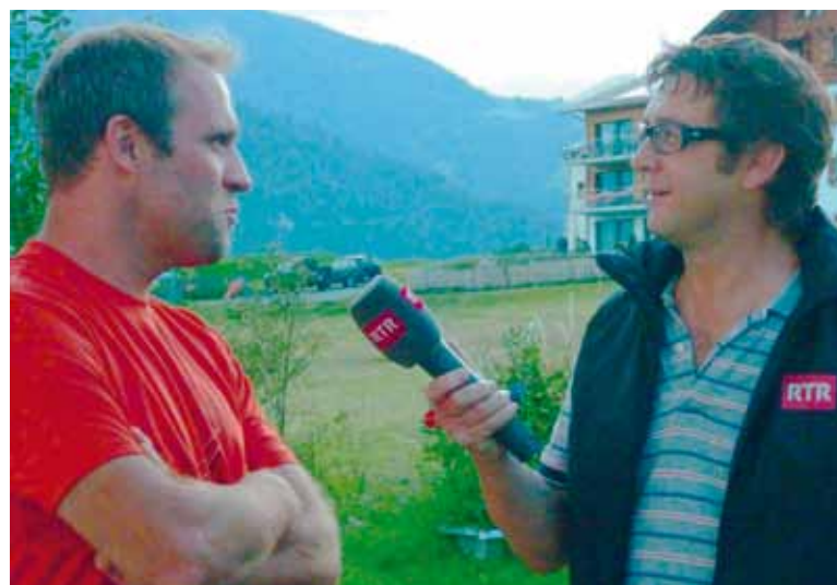
Il contact cun la populaziun è impurtant per il correspondent dad RTR.

Sper il fatg che la glied preferescha savens da dir nagut, datti anc in auter aspect interessant che jau hai constatà. Per ina part da la glied è il correspondent adina in pau suspect. "Sesa el ussa a la canorta per spiunar e chattar temas. U è el simplmain qua per