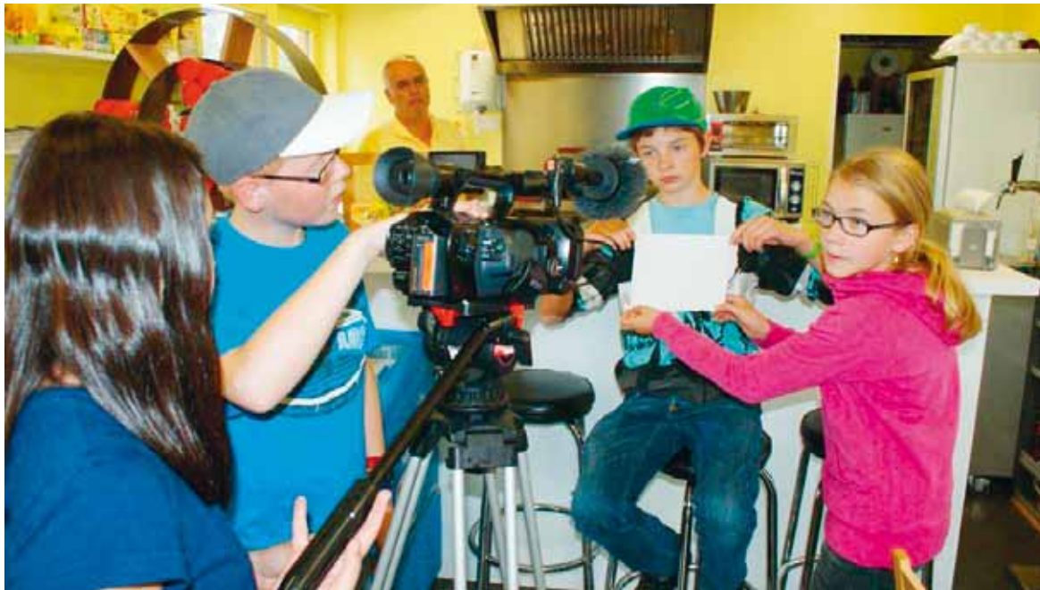
„Far in film“ è stà per ils uffants in eveniment fitg spezial. Durant l'emna ch'è vegnida purschida dad RTR han els pudì star davant e davos la camera.

L'emprim han els stui far exercizis ed elavurar il cudeschet per ils dus films. Il punct da partenza è stada ina idea ch'ils uffants han sviluppà sez: l'istorgia CSI Scuol, la morta sparida. Sviluppà il storyboard ha duvrà perseveranza. Quant bain ha fatg en la pausa la battosta d'aua ora sper la funtauna, davant la chasa da Pravenda a Scuol. Mez l'emna è vegnì mess sin youtube in clip da reclama per che parents ed enconuschents vegnian il venderdi a guardar ils resultats da la lavur da l'emna. Ils uffants han sviluppà las istorgias, han filmà, èn stads davant e davos la camera, han controllà che tut las sequenzas sajan filmadas e che las cadraschas sajan en urden. Il davos èn vegnids tagliads ensemen ils purtrets. Musica è vegnida tschernida ed ils titels èn vegnids scrits. Il temp ha perfin tanschi per far in stuc cun la camera zuppada.