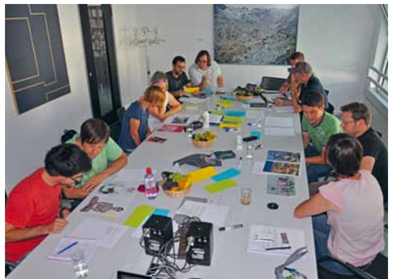
Raquintar istorgias è ina part impurtanta da la lavur da redacturas e redactors da RTR.

Il menu da questa furmaziun han la partiziun tecnica e la redacziun organisà comunablamain. Betg che nus da la TR fissan ussa ils cuschiniers perfetgs, ma cuschinar en furma da team fa ussa anc dapli plaschair, e las produziuns vegnan servidas davent dad ussa pli frestgas ed anc pli gustusas. Laschai gustar!