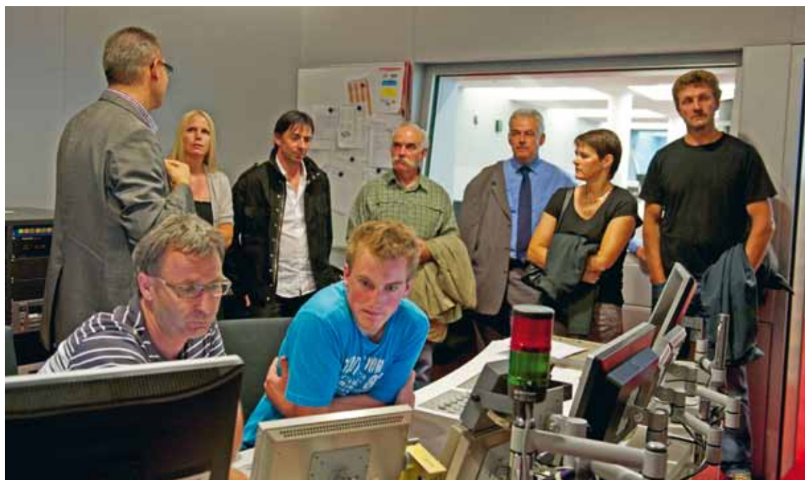
RTR preschenta regularmain sia interpresa a represchentants ed a represchentantas da las regiuns.

(mt) Sursassiala è in num vegl per la part sur la chavorgia da la Val Russein sisum la Cadi e cumpiglia las vischnancas da Mustér, Medel e Tujetsch. Las autoritads communalas, mo era personas en uffizis publics e nossas collavuraturas e collavuratur che derivan u ch'abiteschan en quelas vischnancas ha RTR envidà en la chasa da medias a Cuira. Questa sentupada vul preschentar noss'interpresa sco patrunda da plazzas attractivas e mussar noss'offerta schurnalistica. La sentupada cun las vischnancas da Sursassiala è stada ils 14 da zercladur. Quai è sta la terza gia che RTR ha organisà in tal inscunter: avant avain nus già visita da Laax e da las vischnancas dal Surses.