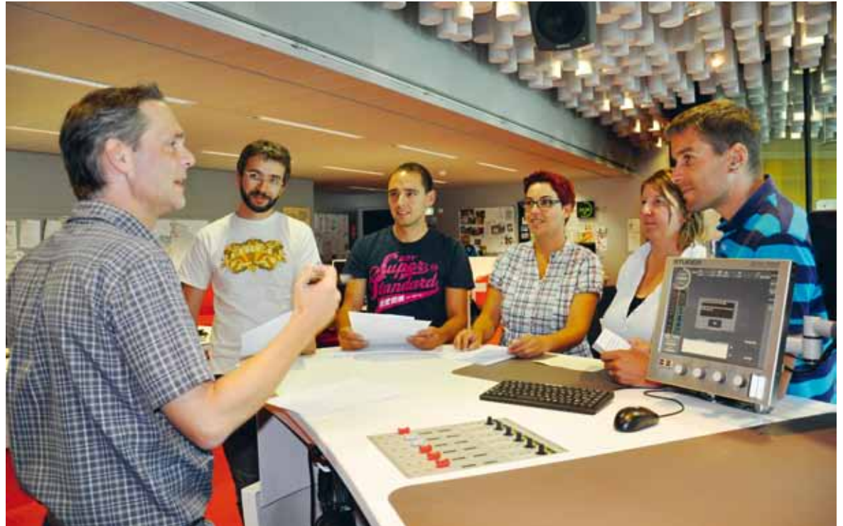
Suenter il magazin da mezdi: redacturas e redactors analiseschan l’emissiun ensemen cun il producent.